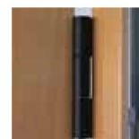
Dobradiça (portas revestidas PVC)