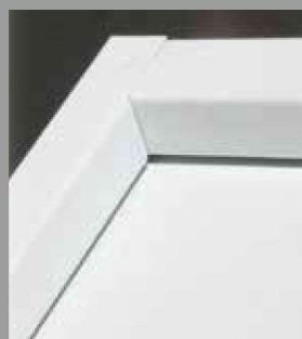
Acabamento do Aro