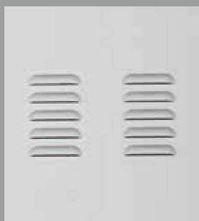
Grelhas de Ventilação