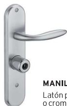
MANILLA Latón pulido o cromado cepillado